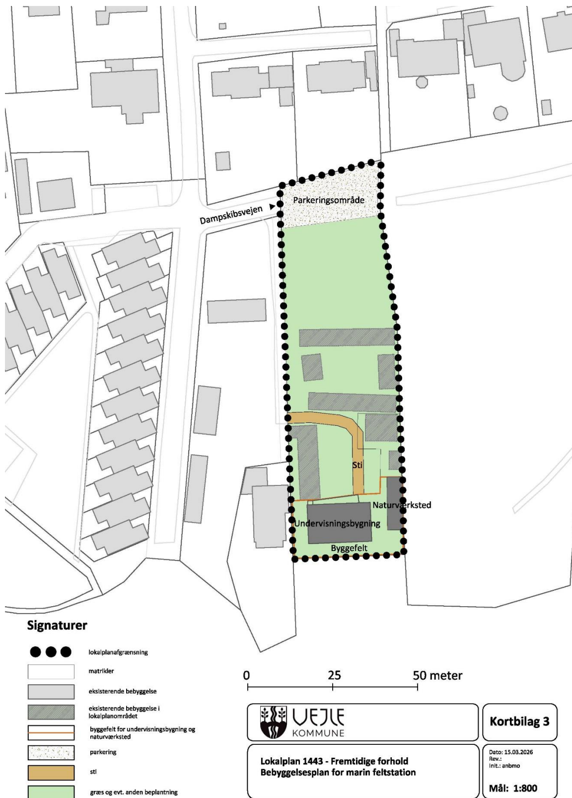
Figur 1 - Fremtidige forhold