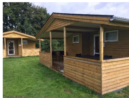
De nye hytter er klar

Udvalget for lokalsamfund og nærdemokrati har støttet et projekt om turisme og nye aktiviteter i landdistrikterne ved at bidrage til nye overnatnings muligheder og et fælles mødested ved Hærvejscentret i Kollemorten. Projektet står nu færdigt og er klar til at byde besøgende velkommen. Formålet med projektet er at styrke sammenholdet i hele lokalområdet, samt at etablere aktiviteter, der tiltrækker turister og tilflyttere.