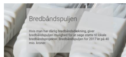
Lige IT vilkår i hele kommunen

To landområder i Vejle Kommune søger Energistyrelsens Bredbåndspulje. Udvalget for lokalsamfund og nærdemokrati har ydet ansøgerne bistand og sikret medfinansiering fra Vejle Kommune. Formålet med projektet er at sikre landområderne bedre internetforbindelse, som igen skal være med til at sikre attraktive lokalsamfund, der kan fastholde og tiltrække borgere.