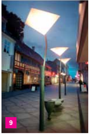
9 Gågadeinventar.