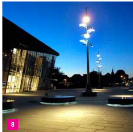
8 Søndertorv med Bryggen