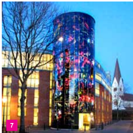
7 P-huset Tróndur.