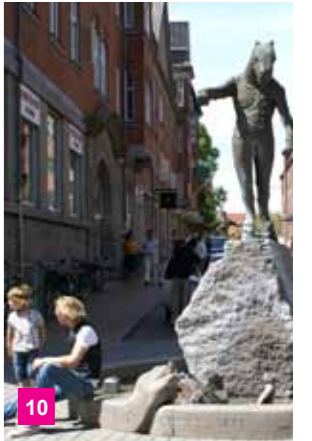
10 Skulptur.