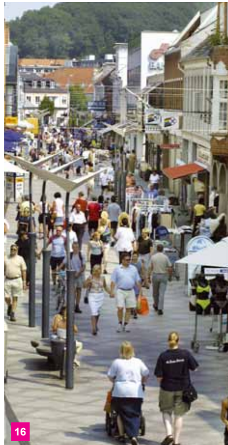
16 Nørregade.