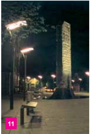
11 Banegårdspladsen, Bjørn Nørgaard