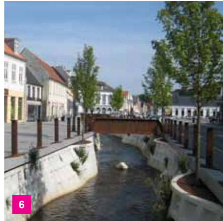
6 Mølleå ved Dæmningen