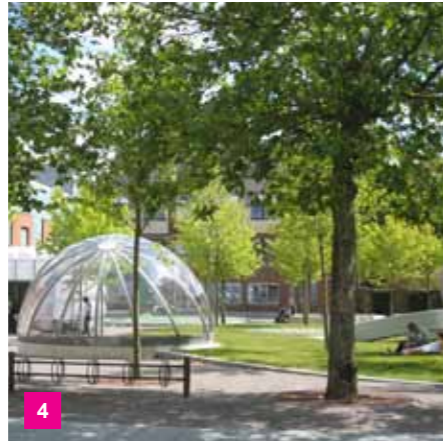
4 Volmers Plads