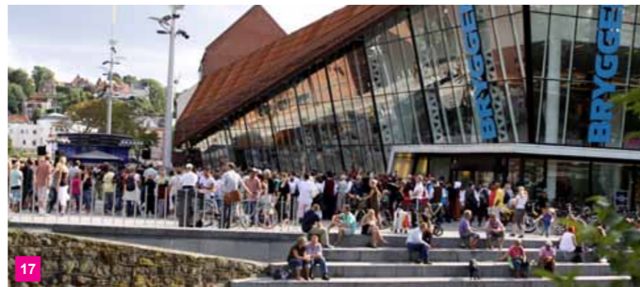
17 Bryggen - shoppingcenter