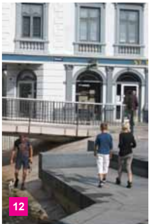
12 Mølleåen frilag.