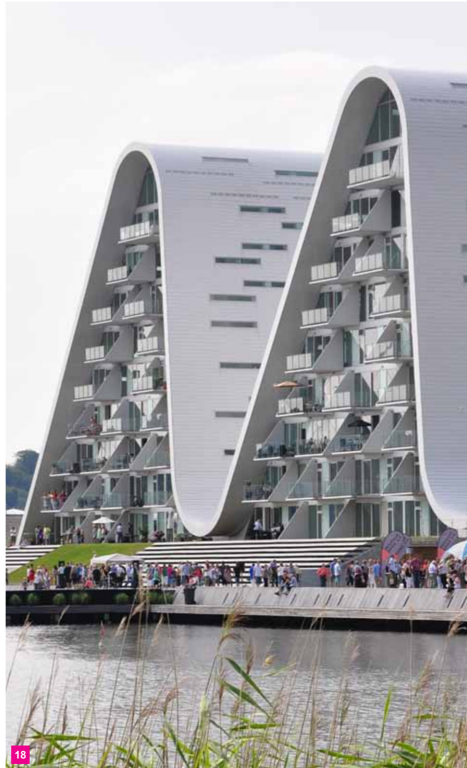
18 Bølgen og ny promenade