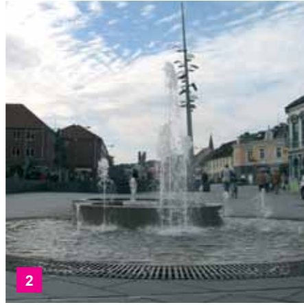
2 Nørretorv - vandkunst