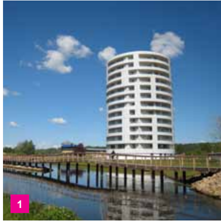
1 De fem søstre