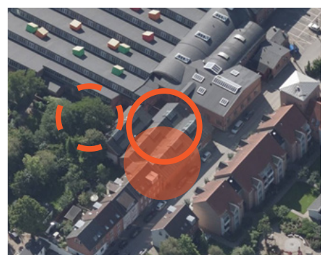
Øverst: Det Gamle Farveri Spinderigade Nederst: Sejmagerværksted Toldbodvej