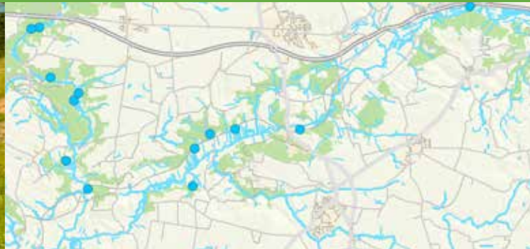
Der er 13 dambrug langs med Vejele Å, og langt de fleste ligger i den øvre ende af ådalen.

Små stationsbyer opstod langs Vandelbanen, og Bindeballe var en af dem. Stationen og købmands-