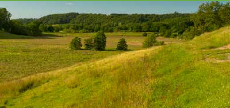
Udsigt ved Runkenbjerg.

mølleri til at male boghvede, er en af disse. I dag udnyttes vandet i åløbene af dambrugene langs både Egtved og Vejele Åer.