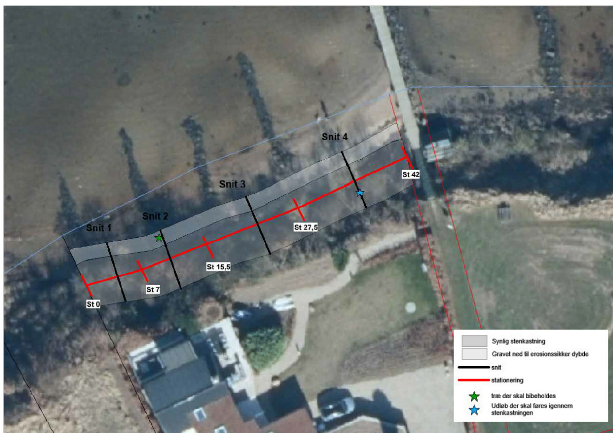
Figur 3 - Plantegning over kystbeskyttelses anlægget

Eksisterende bevoksning i anlægsområde fjernes. Eksisterende sten genanvendes i ny beskyttelse. Fra foden af stenkastningen graves ud til at kunne etablere stenkastningen til erosionssikker dybde. Geotex udlægges nederst rallag udlægges og dernæst dækstenlaget. Overskydende udgravningsmateriale lægges op ad stenkastningen. Gammelt træ bevares og udløb indarbejdes i ny stenkastning jf. plantegning.