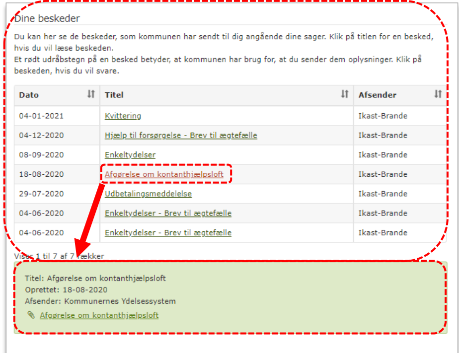
Billede 4: Dine beskeder