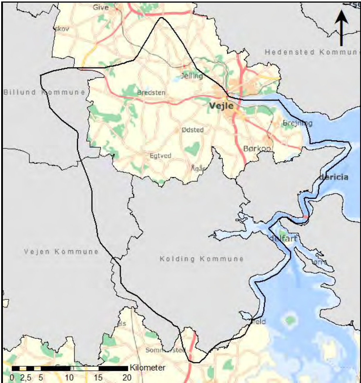
Kort over modelafgrænsningen for Trekantområdet