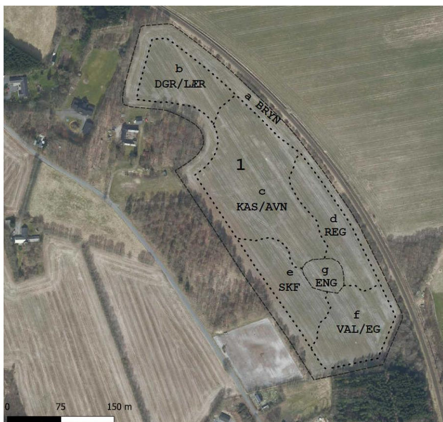
Kort fra anmelder.

Vejle Kommune har den 3. oktober 2022 modtaget din anmeldelse af skovrejsning på matr.nr. 13x Kokborg By, Thyregod. Ifølge §§ 8 og 9 i bekendtgørelse om jordressourcens anvendelse til dyrkning og natur, skal du anmelde / ansøge om skovrejsning, inden du planter skoven. Nedenfor ses oversigtskort over det anmeldte areal med angivelse af type skov og arter.