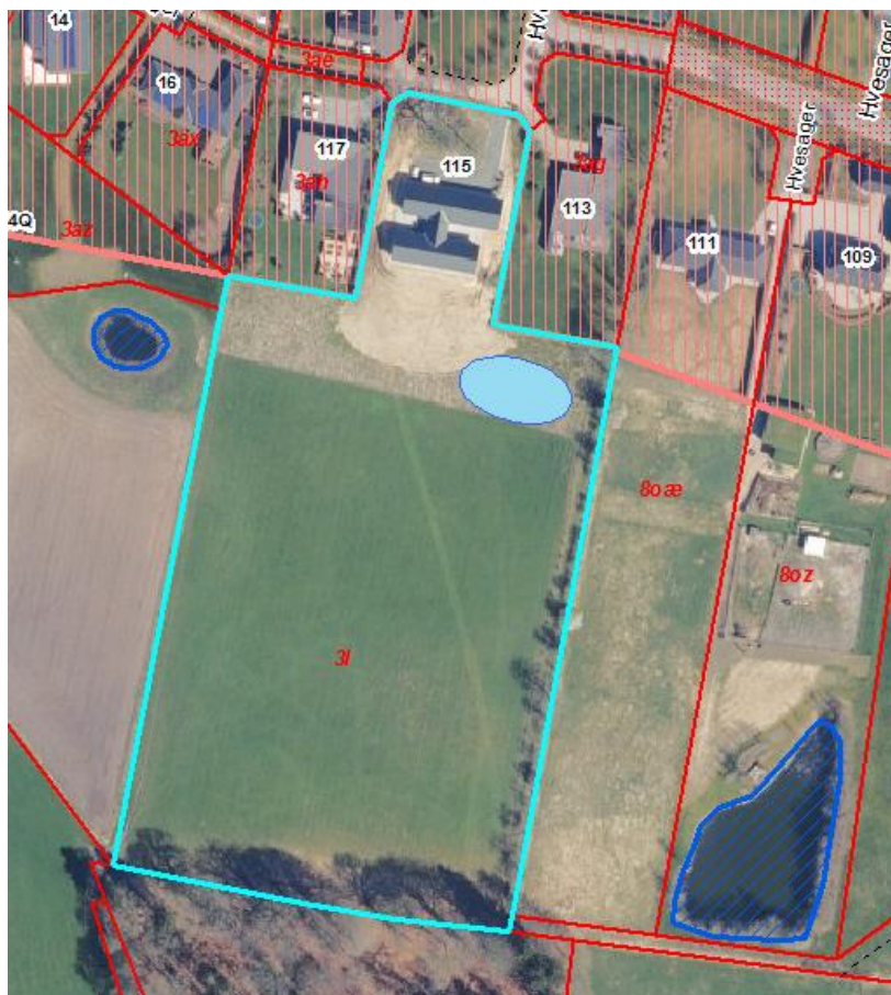
Den omtrentlige placering af vandhullet er vist med lyseblå signatur.

Det område, hvor du ønsker at placere vandhullet er vist på kortet nedenfor.