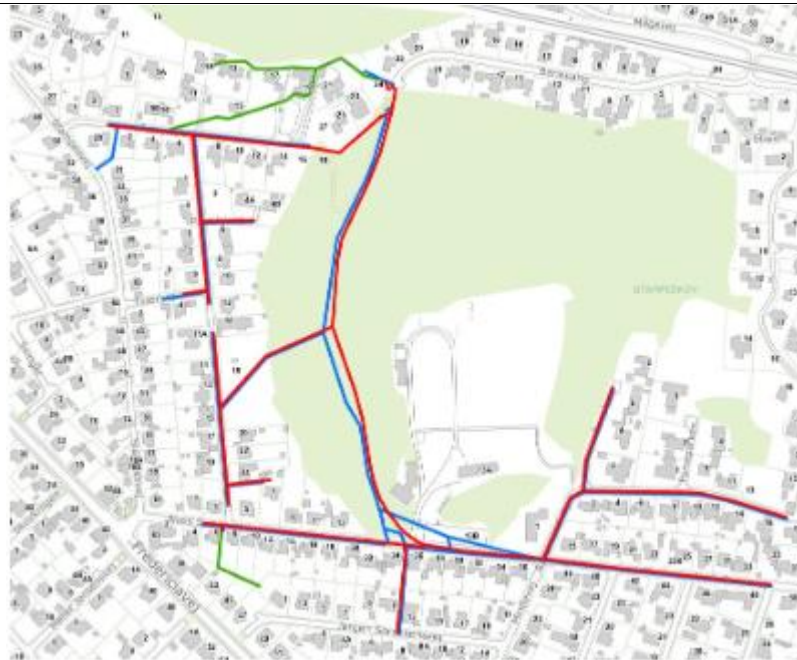
Illustration 2: Viser delvist placeringen af kommende ledninger og eksisterende fællesprivate ledninger i kloakområdet. Røde ledninger er kommende spildevandsledninger, blå ledninger er kommende regnvandsledninger og grøn er eksisterende fællesprivate ledninger.