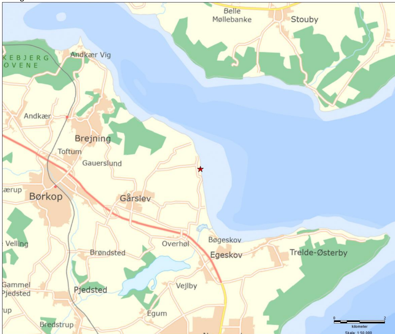
Bilag kort 1:50000