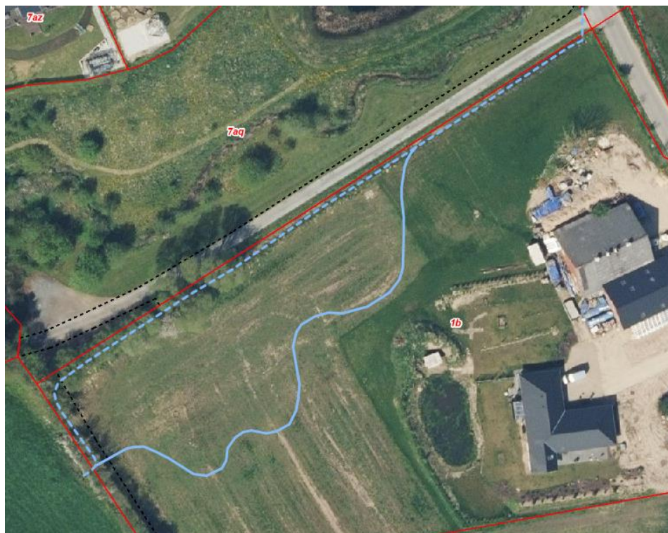
Figur 1: Oversigtskort. Grøftens eksisterende forløb er markeret med stiplet, blå streg, og det omtrentlige fremtidige forløb med hel, blå streg.

Ansøgningen har været i offentlig høring i 4 uger. Vejle Kommune har ikke modtaget skriftlige høringsvar i perioden.