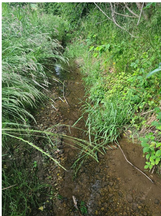
Figur 3: Kommunen har besøgt forholdene i juni. Ansøger oplyser, at grøften er vandførende året rundt.