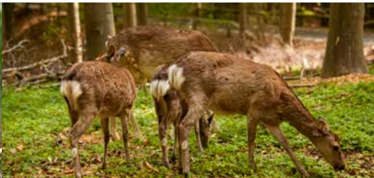
Hinderne (hunnerne) lever i flok med en førerhun – om vinteren kan hannerne også samles i flok.