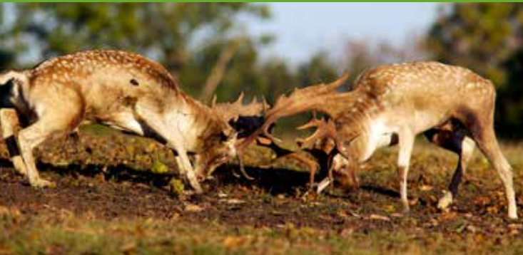
Dådyrhjorte i kamp på brunstpladsen.