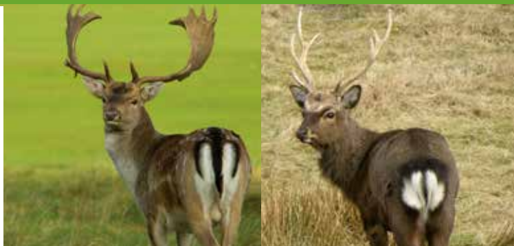
Dåhjort – der står 111 på bagen.

Du kan se forskel på dådyr og sikaer på spejlet/bagpartiet. Området er hvidt med en kant af sorte hår på begge dyr – men den sorte stribe på halen er bredere på dådyret.