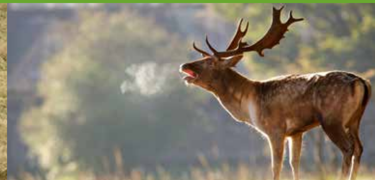
Hjorten har så travlt i brunsttiden, at han ikke har tid til at æde. Han taber derfor voldsomt i vægt.