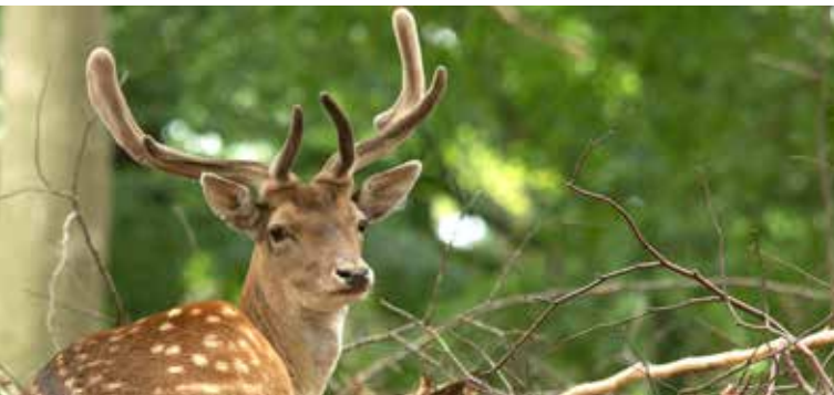
Dåhjort med skovlformet gevir og med basten intakt.

Efteråret er hårdt for hjortevildtet. Her kæmper hannerne om hunnerne, og samtidig skal de æde sig tykke og fede for at klare vinterens frost og sne. Brunsten ligger i oktober-november.