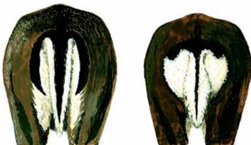
Illustration: Beth Beyerholm og denstoredanske.dk.

Du kan se forskel på dådyr og sikaer på spejlet/bagpartiet. Området er hvidt med en kant af sorte hår på begge dyr – men den sorte stribe på halen er bredere på dådyret.