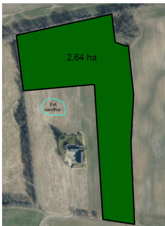
Figur 1: Luftfoto med angivelse af skovrejsningsareal (grøn markering). Kort indsendt af anmelder.

Skovrejsning er omfattet af miljøvurderingslovens bilag 2, pkt. 1d 2 . Derfor skal kommunen screene din ansøgning med henblik på at vurdere, om dit projekt kan medføre en væsentlig ændring af miljøet og dermed være omfattet af miljøvurderingspligt. Kommunens afgørelse ses på s. 3.