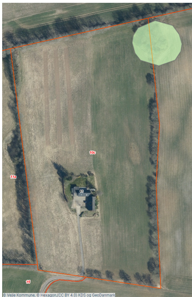
Figur 4: Luftfoto med angivelse af skovrejsning uønsket (grøn markering) samt matrikelgrænser (røde linjer).