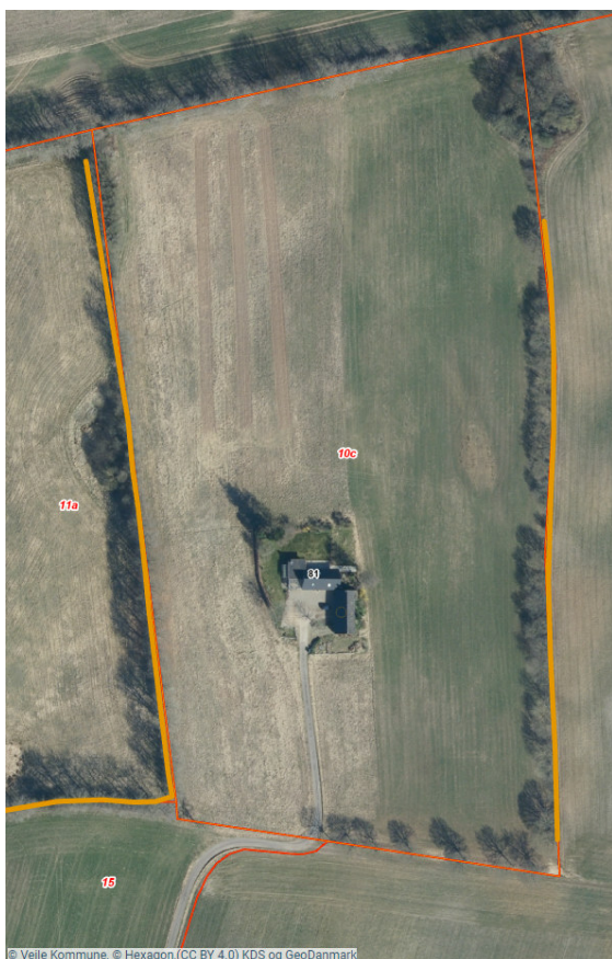
Figur 3: Luftfoto med angivelse af beskyttede diger (orange linjer) samt matrikelgrænser (røde linjer).