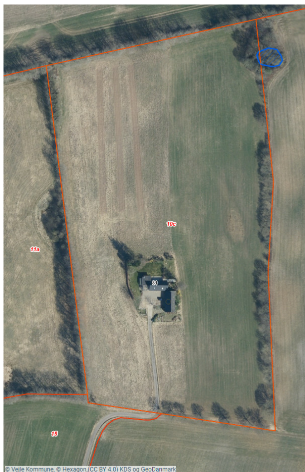
Figur 2: Luftfoto med angivelse af beskyttet vandhul (blå skravering) samt matrikelgrænser (røde linjer).