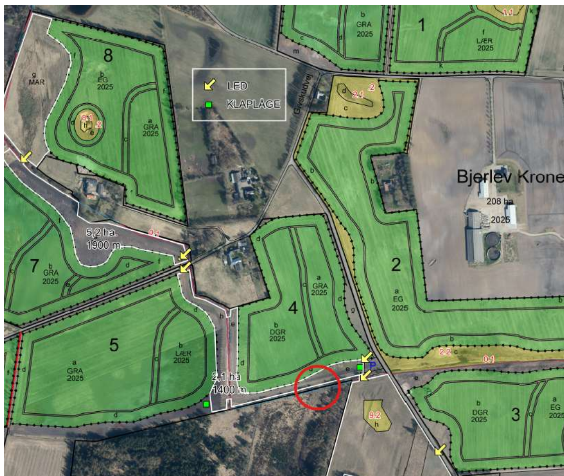
Figur 2: Udsnit af oversigtskort fra ansøgning. Projektområde markeret med rød cirkel.