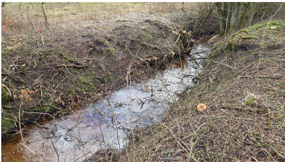
Figur 3: Billede fra ansøgningen af den pågældende strækning, hvor røroverkørslen ønskes etableret.