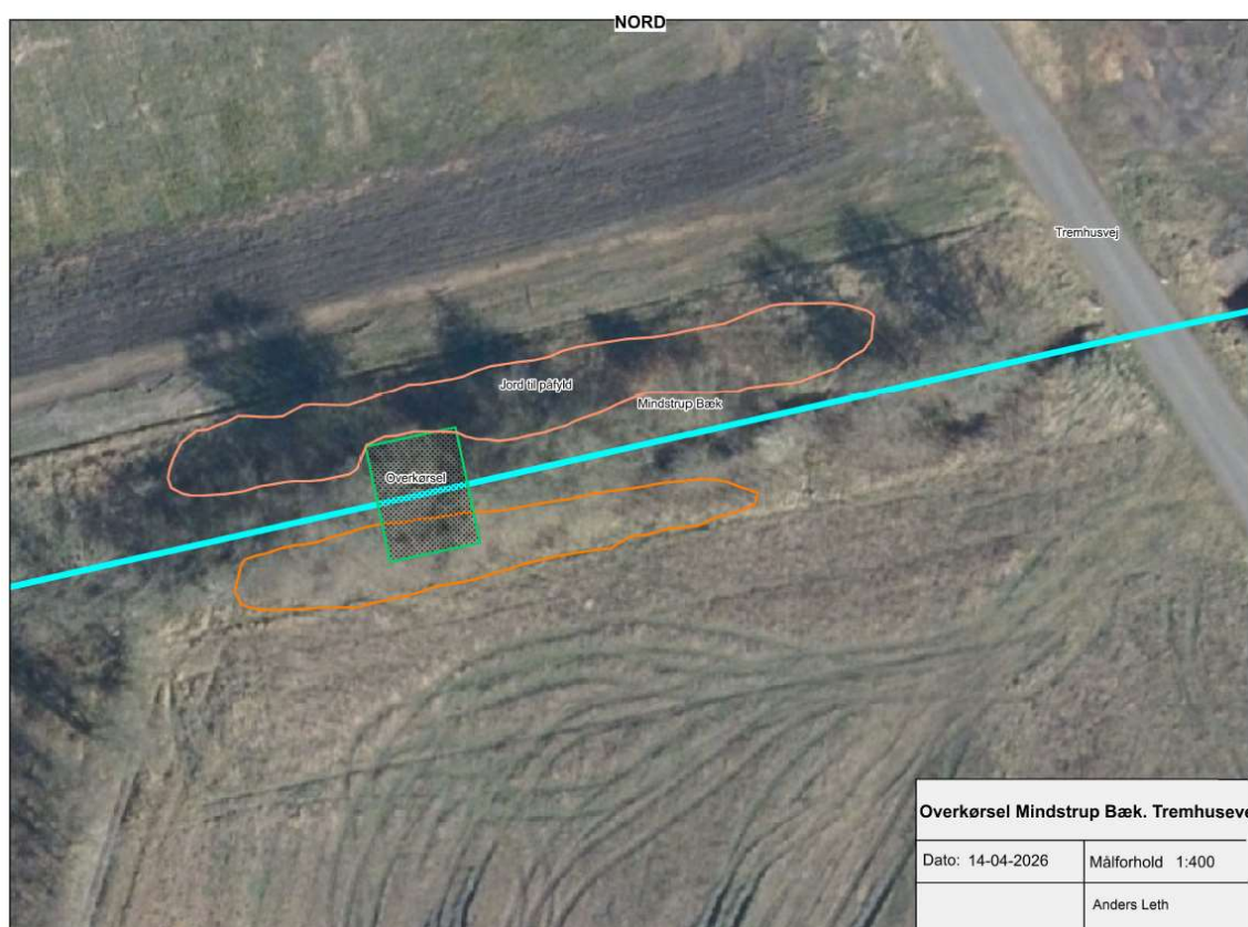
Figur 4: Detailkort fra ansøgning. Overkørslen er fremhævet som grøn flade.