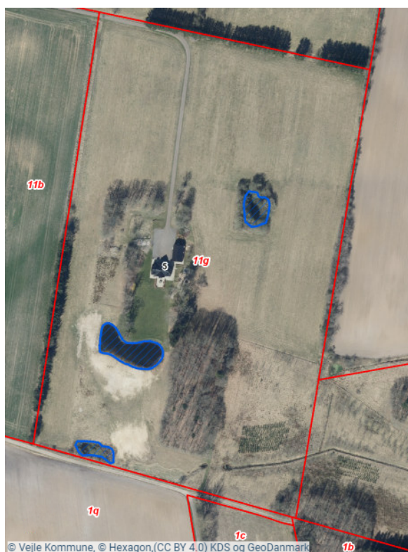
Figur 2: Luftfoto med angivelse af beskyttede vandhuller (blå skravering) samt matrikelgrænser (røde linjer).