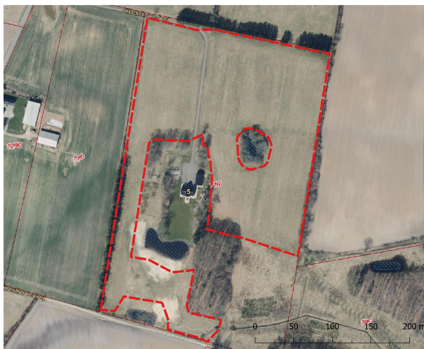
Figur 1: Luftfoto med angivelse af skovrejsningsprojekt, rød afgrænsning. Kort indsendt af anmelder.

Vejle Kommune har den 16. marts 2026 modtaget din anmeldelse af skovrejsning på matr.nr. 11g Give By, Give beliggende på adressen Sillesthovedvej 5, 7323 Give. Ifølge §§ 6 og 7 i bekendtgørelse om jordressourcens anvendelse til dyrkning og natur 1 , skal du anmelde/ansøge om skovrejsning, inden du planter skoven. Du har anmeldt skovrejsning på 5,8 ha. Skoven vil bestå af overvejende løv med nåletræ indblandet i holme. Skoven etableres med et skovbryn for at sikre læ og stabilitet i skoven og et godt skovklima. Nedenfor ses et oversigtskort af det anmeldte skovrejsningsareal.