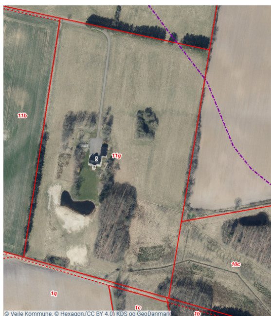
Figur 4: Luftfoto med angivelse af pumpeledning, lilla linje. Røde linjer angiver matrikelgrænser.