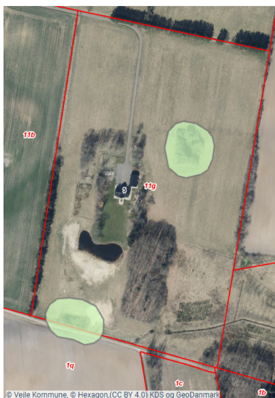
Figur 3: Luftfoto med angivelse af arealer udpeget som skovrejsning uønsket (grøn markering) samt matrikelgrænser (røde linjer).

Som det ses på nedenstående kort, er der ikke udpeget en bufferzone for det midterste vandhul, da vandhullet er etableret, efter udpegningerne med skovrejsning uønsket blev registreret. Vandhullet er beskyttet af naturbeskyttelseslovens § 3, og krav om en beplantningsafstand på 20 meter til vandhullet er stadig gældende.