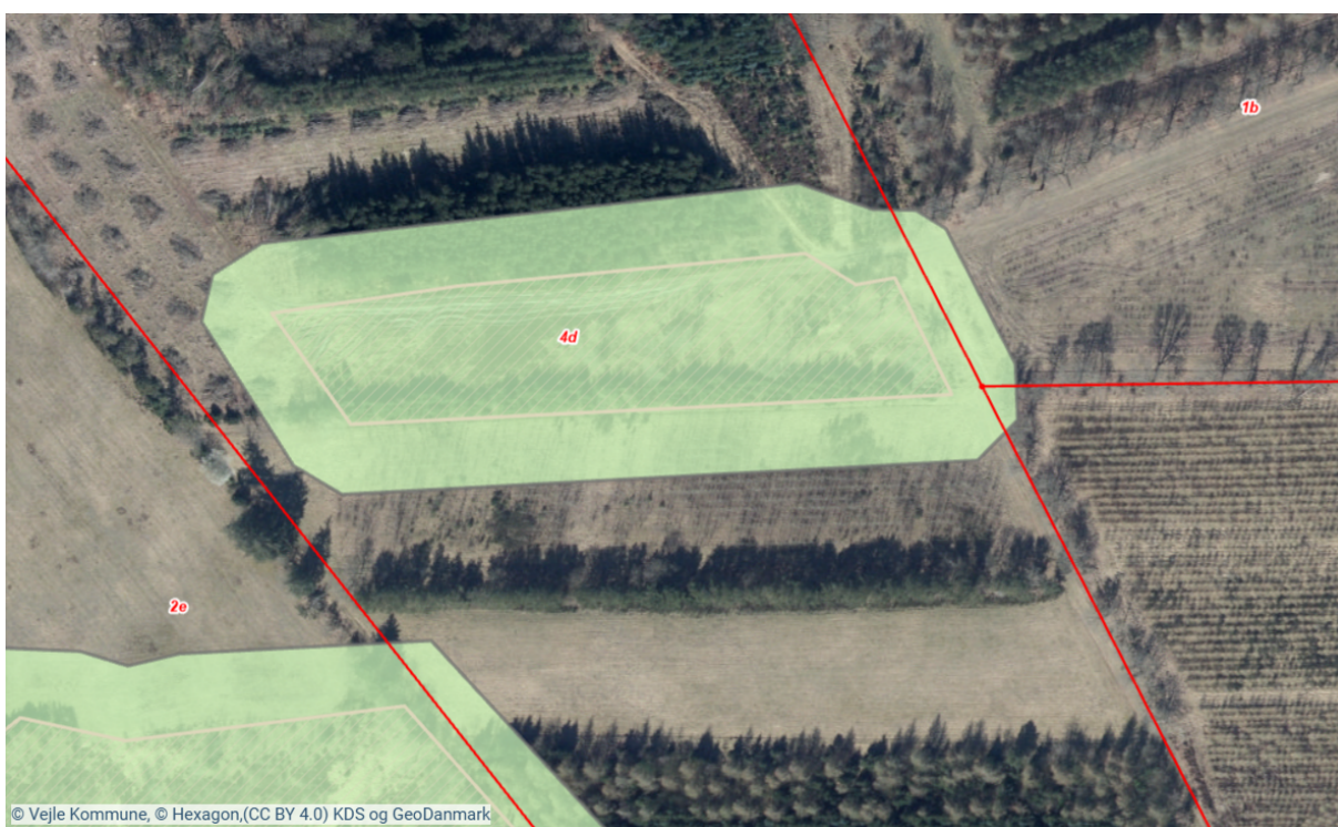
Figur 1-2: Oversigtskort med angivelse af beskyttede hede (hede – lyserød) samt skovrejsning uønsket (grøn markering).

På matrikel 4d Ullerup, Give grænser det anmeldte areal op til to beskyttede heder. Det vurderes konkret at skovrejsning kan ske uden respektafstand på begge arealer udlagt som skovrejsning uønsket, hvorfor der meddeles dispensation fra §7. stk. 2. se kort med luftfoto herunder