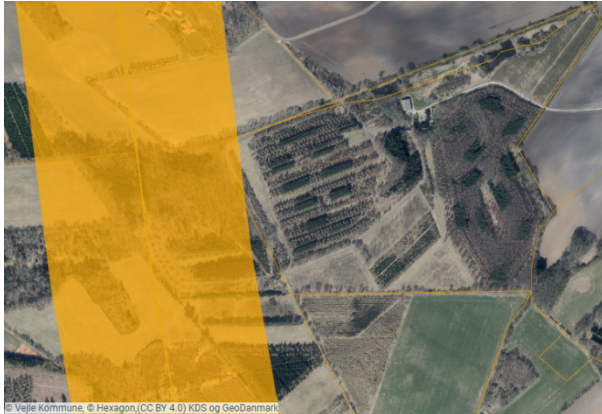
Figur 2: Oversigtskort med angivelse af ledning (orange fed linje) og observationszone (orange markering).

En del af det anmeldte areal ligger inden for observationszonen til en gastransmissionsledning. Vejle Kommune gør opmærksom på, at det er byherres eget ansvar at overholde eventuelle tinglyste afstande til ledningen. Se oversigtskort nedenfor med angivelse af ledning og observationszone.