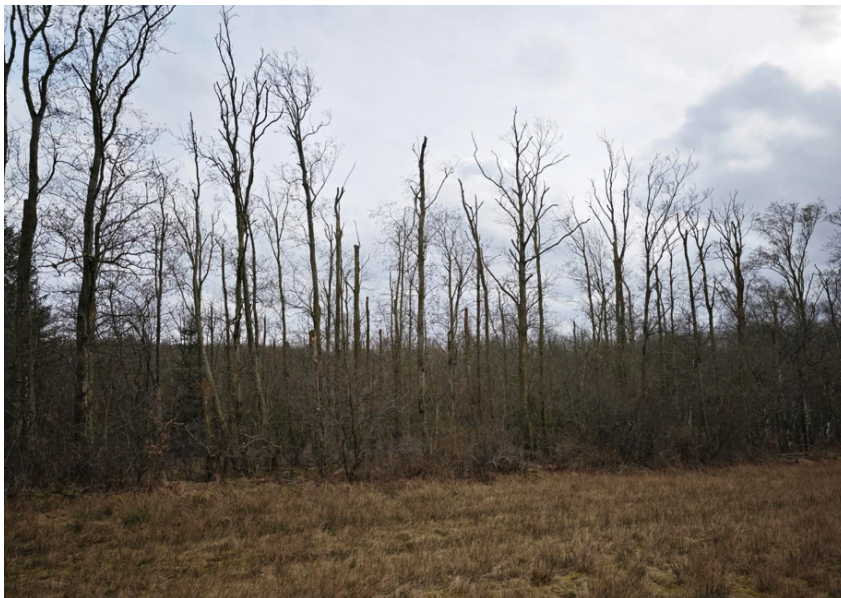
Figur 1-4: Foto af mosens kant mod det åbne areal hvor der ønskes skovetablering.