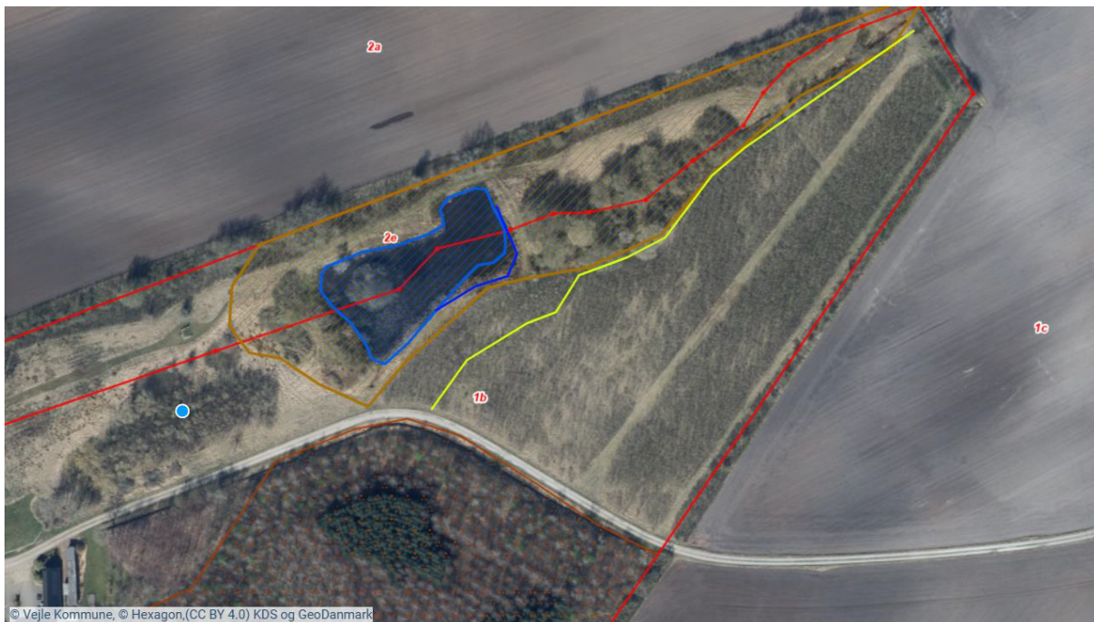
Figur 1-1: gul streg viser afstand for skovrejsning til beskyttet mose og sø.

På matrikel 4d Ullerup, Give grænser det anmeldte areal op til to beskyttede heder. Det vurderes konkret at skovrejsning kan ske uden respektafstand på begge arealer udlagt som skovrejsning uønsket, hvorfor der meddeles dispensation fra §7. stk. 2. se kort med luftfoto herunder