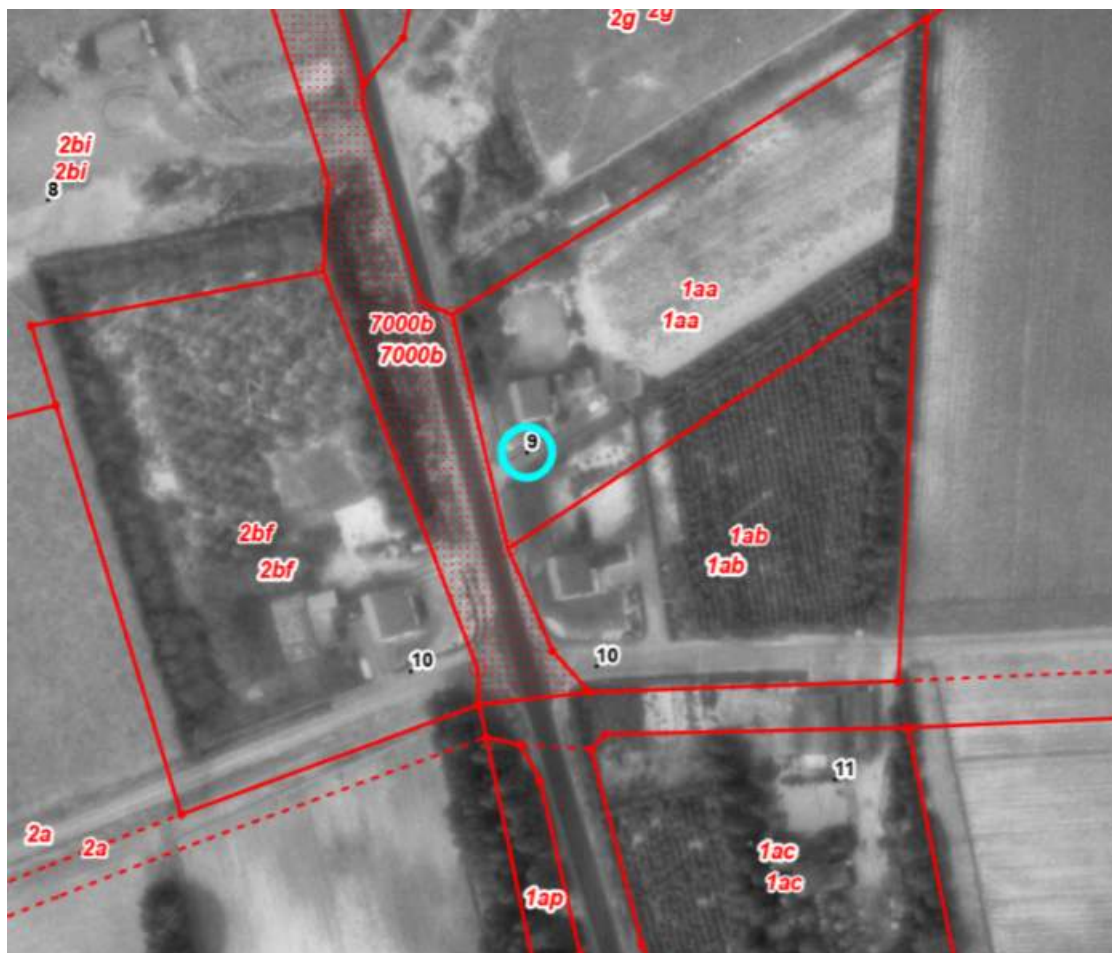
Figur 7. Luftfoto fra 1973 der viser ejendommens placering (matr.nr. 1aa) i landlige omgivelser med blot tre andre boliger i nærområdet (matr.nr. 2bf, 1ab og 1ac).

Vejle Kommune gør dog opmærksom på, at ejendommen stadig ligger inden for åbeskyttelseslinjen, og Vejle Kommune vurderer, at Give Kommunes vurdering i 1987 af, at der er tale om en væsentlig lovlig bebyggelse fra før 1972, ikke lever op til nuværende gældende praksis, idet ejendommen i 1972 – som i dag – lå i landlige omgivelser med blot tre andre ejendomme i nærområdet (se figur 7). Vejle Kommune vurderer derfor, at Give Kommunes vurdering af, at sagen ikke skulle videresendes til fredningsmyndigheden (amtet), der var myndighed på åbeskyttelseslinjen dengang, var en fejl. Vejle Kommune vurderer således ikke, jf. gældende praksis, at der er tale om samlet bebyggelse, der er undtaget forbuddet.