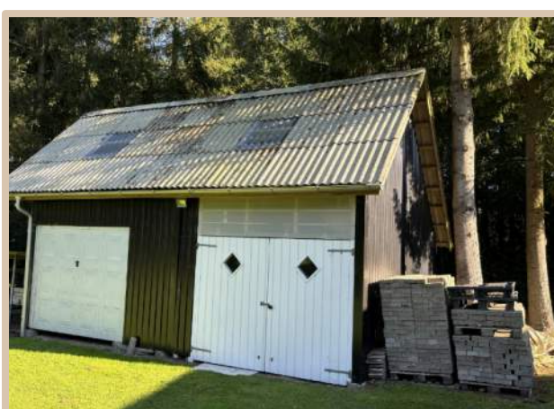
Figur 3. Billeder af de seks bygninger på ejendommen: lysthus (gul), udestue (blå), drivhus (lilla), hønseshus (rød), tilbygning til garage (grøn), skur (orange).