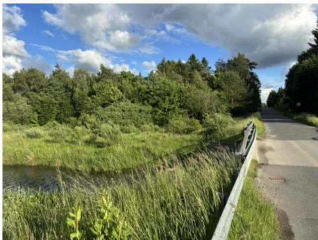
Figur 4. Ejendommen set fra åen. Det fremgår, at ejendommens bygninger ikke er synlige i landskabet, da både den beskyttede mose og selve ejendommen indeholder en del træer.

Ejendommen ligger i dag omkranset af store træer, og der er desuden mellem åen og ejendommen en beskyttet mose, hvor der gror en del piletræer. Det er således ikke muligt at se ejendommen fra åen (se figur 4). Ejer oplyser dog, at det var muligt at se ejendommen fra åen, da ejer flyttede ind i 1983.