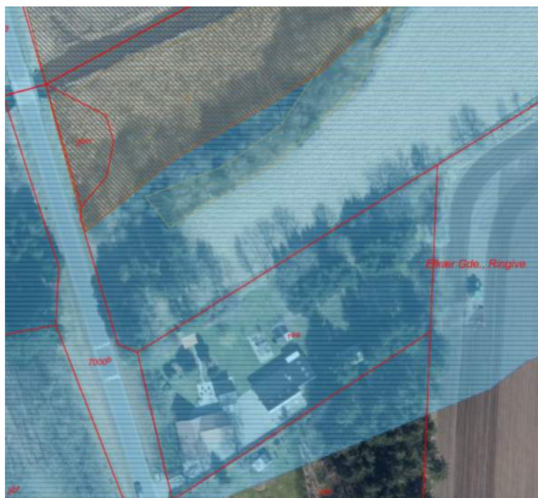
Figur 1. Hele ejendommen beliggende på matr.nr. 1aa Elkær Gde., Ringive ligger inden for åbeskyttelseslinjen afkastet af Omme Å (blå skravering).

Vejle Kommune modtog den 25. september 2025 din ansøgning om lovliggørelse af en tilbygning samt tre mindre bygninger opført på din ejendom beliggende på matr.nr. 1aa Elkær Gde., Ringive med adressen Elkjærvej 9, Give. Ejendommen er beliggende inden for åbeskyttelseslinjen afkastet af Omme Å (se figur 1). I sagsbehandlingen er Vejle Kommune blevet bekendt med, at der også på ejendommen er opført et drivhus samt et hønsehus. Vejle Kommune meddeler hermed efterfølgende lovliggørende dispensation for alle seks bygninger opført på din grund.