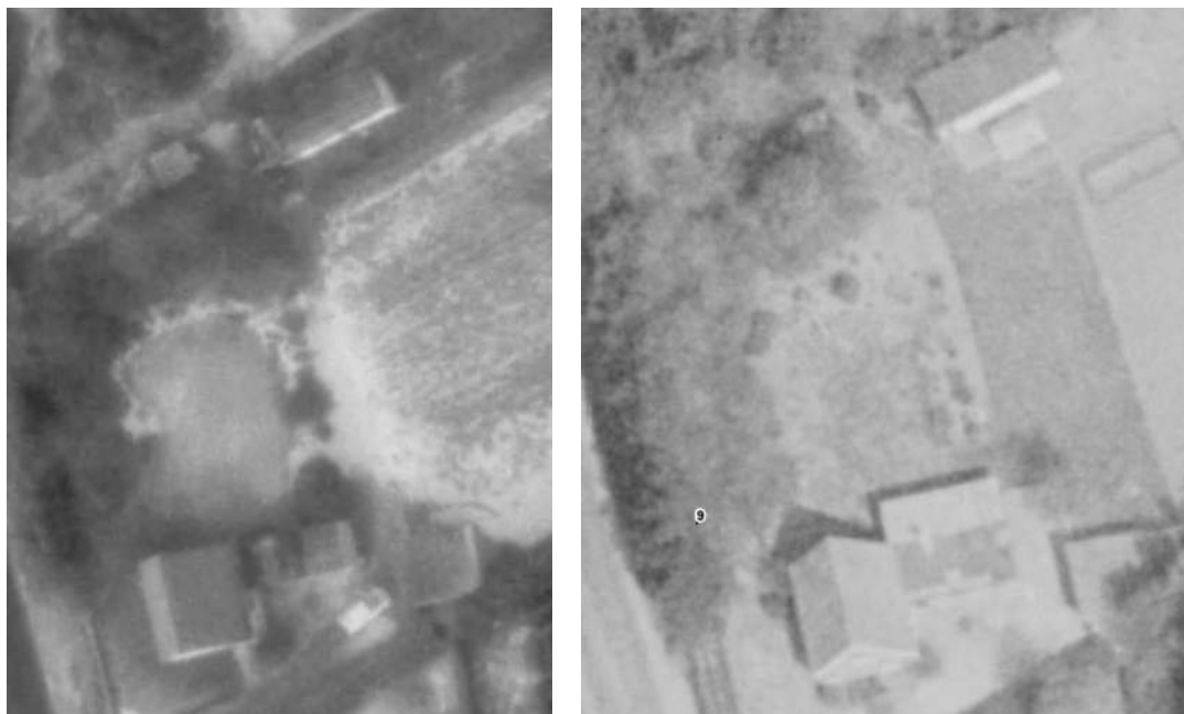
Figur 6. Flyfotos af ejendommen fra 1973 (venstre) og 1985 (højre).