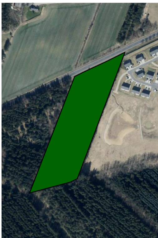
Figur 1: Luftfoto med angivelse af skovrejsningsareal, grøn markering. Kort indsendt af anmelder.

Skovrejsning er omfattet af miljøvurderingslovens bilag 2, pkt. 1d 2 . Derfor skal kommunen screene din ansøgning med henblik på at vurdere, om dit projekt kan medføre en væsentlig ændring af miljøet og dermed være omfattet af miljøvurderingspligt. Kommunens afgørelse ses på s. 3.