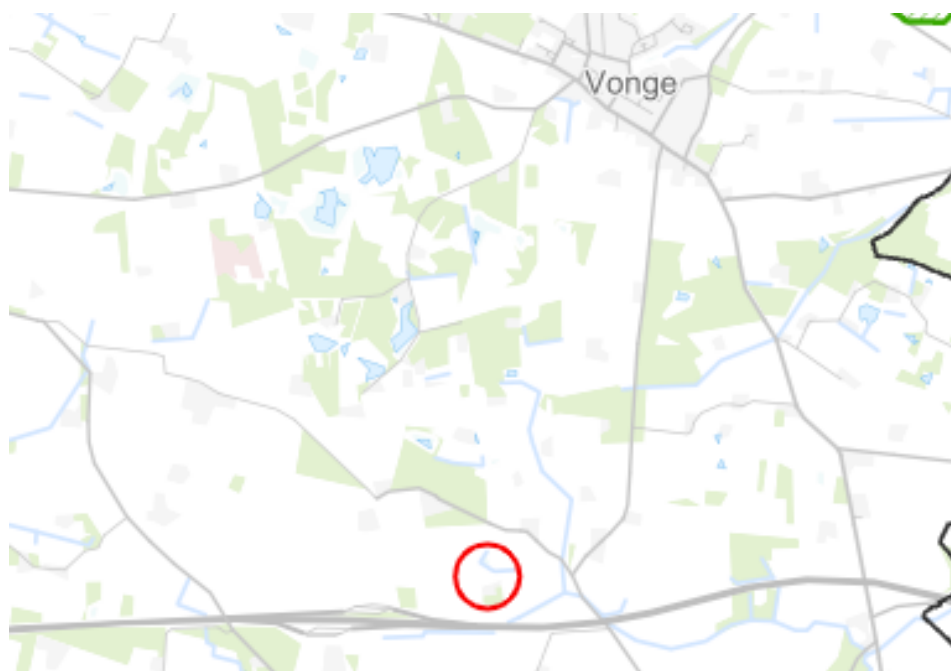
Figur 1: Oversigtskort. Projektområde markeret med rød cirkel.

Ansøgningen har været i offentlig høring i 4 uger. Vejle Kommune har ikke modtaget skriftlige høringssvar i perioden.