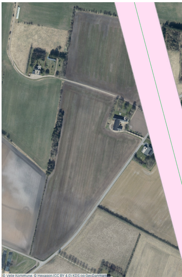
Figur 3: Luftfoto med angivelse af opmærksomhedszone (lyserød markering) samt luftledningstrace (grøn linje).

Vejle Kommune gør opmærksom på, at det er bygherres eget ansvar at overholde eventuelle tinglyste afstande til ledningen.