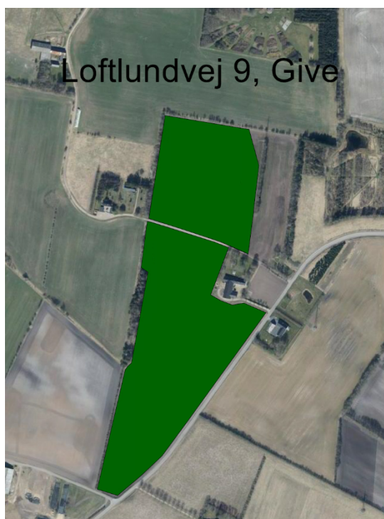
Figur 1: Luftfoto med angivelse af anmeldt skovrejsningsareal, grøn markering. Kort indsendt af anmelder.

Skovrejsning er omfattet af miljøvurderingslovens bilag 2, pkt. 1d 2 . Derfor skal kommunen screene din ansøgning med henblik på at vurdere, om dit projekt kan medføre en væsentlig ændring af miljøet og dermed være omfattet af miljøvurderingspligt. Kommunens afgørelse ses på s. 3.